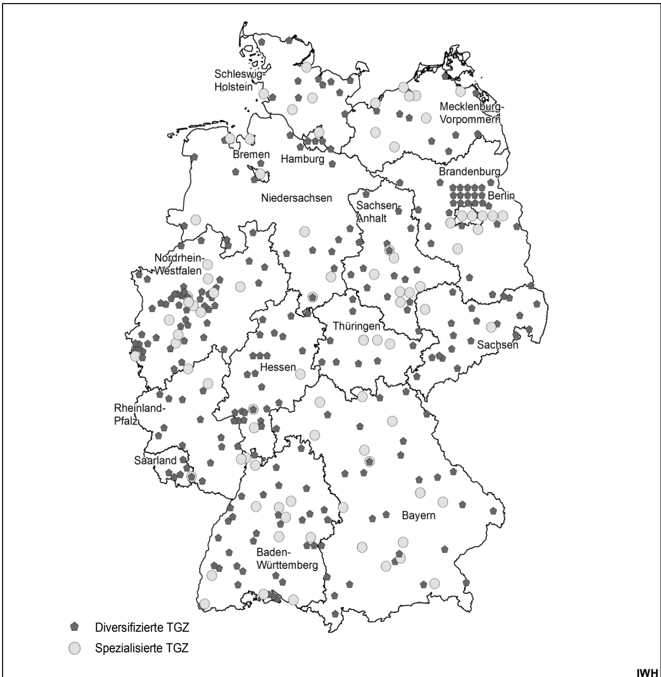
Abbildung 3: Standorte diversifizierter und spezialisierter TGZ in Deutschland (Stand: Januar 2010)