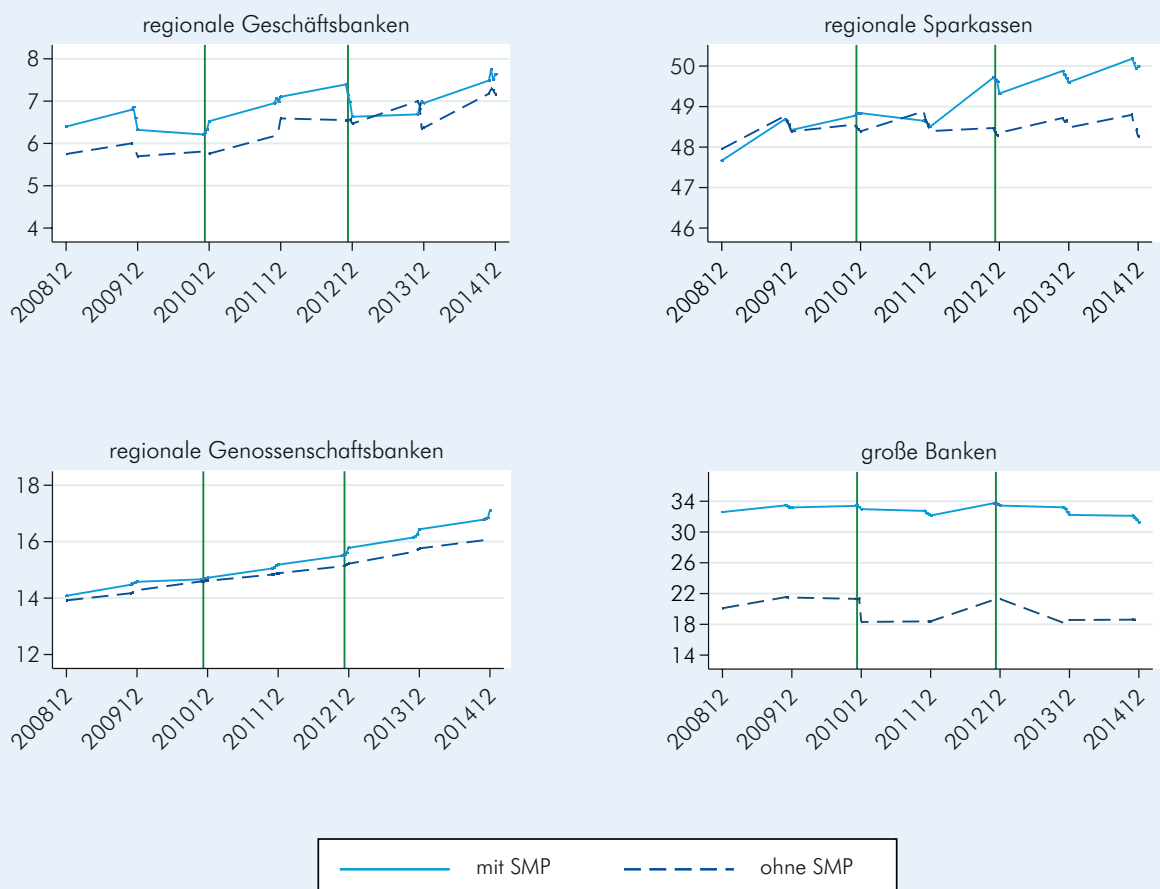
Abbildung 2 Marktanteile an den Kundenkrediten pro Landkreis, je Bankengruppe und Jahresquartal in %

Es kann ein positiver Wettbewerbseffekt des Programms gemessen an den Marktanteilen beobachtet werden: Banken mit SMP-Vermögenswerten hatten nach dem Start des Programms Marktanteile, die 60 Basispunkte (d. h. 0,6 Prozentpunkte) höher lagen als die der nicht betroffenen Banken. Unter Berücksichtigung der Tatsache, dass die durchschnittlichen Marktanteile der Banken ohne SMP-Vermögenswerte in ihrem jeweiligen Landkreis um 22% lagen, ist das ein moderater Effekt. Er gibt jedoch einen Anhaltspunkt für die möglichen unbeabsichtigten Konsequenzen unkonventioneller Geldpolitik. Auch wenn die regionalen Sparkassen und Genossen-